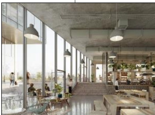
Perspective du rez-de-chaussée

Le coliving est une nouvelle forme d'habitat axée sur le partage. Il allie espaces privés et espaces partagés, de nombreux services mutualisés (ménage, Wi-Fi, abonnements, transports...), le tout associé à des baux de moyenne durée particulièrement flexibles.