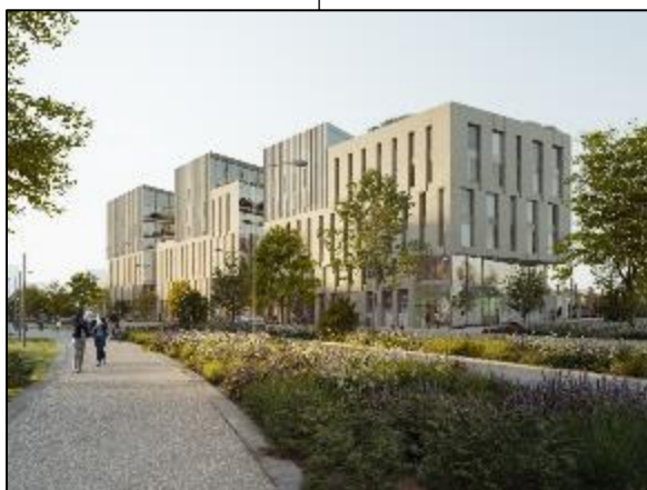
Vue depuis le futur cours de la rotonde

A l'issue d'un Appel à Manifestation d'intérêt, le Groupe Edouard DENIS a été sélectionné pour la réalisation de bâtiments mixtes sur le futur quartier de la Cassine à Chambéry. Le programme proposera sur 10 000 m 2 environ des bureaux, de nouveaux modes d'habiter, des services et des commerces.