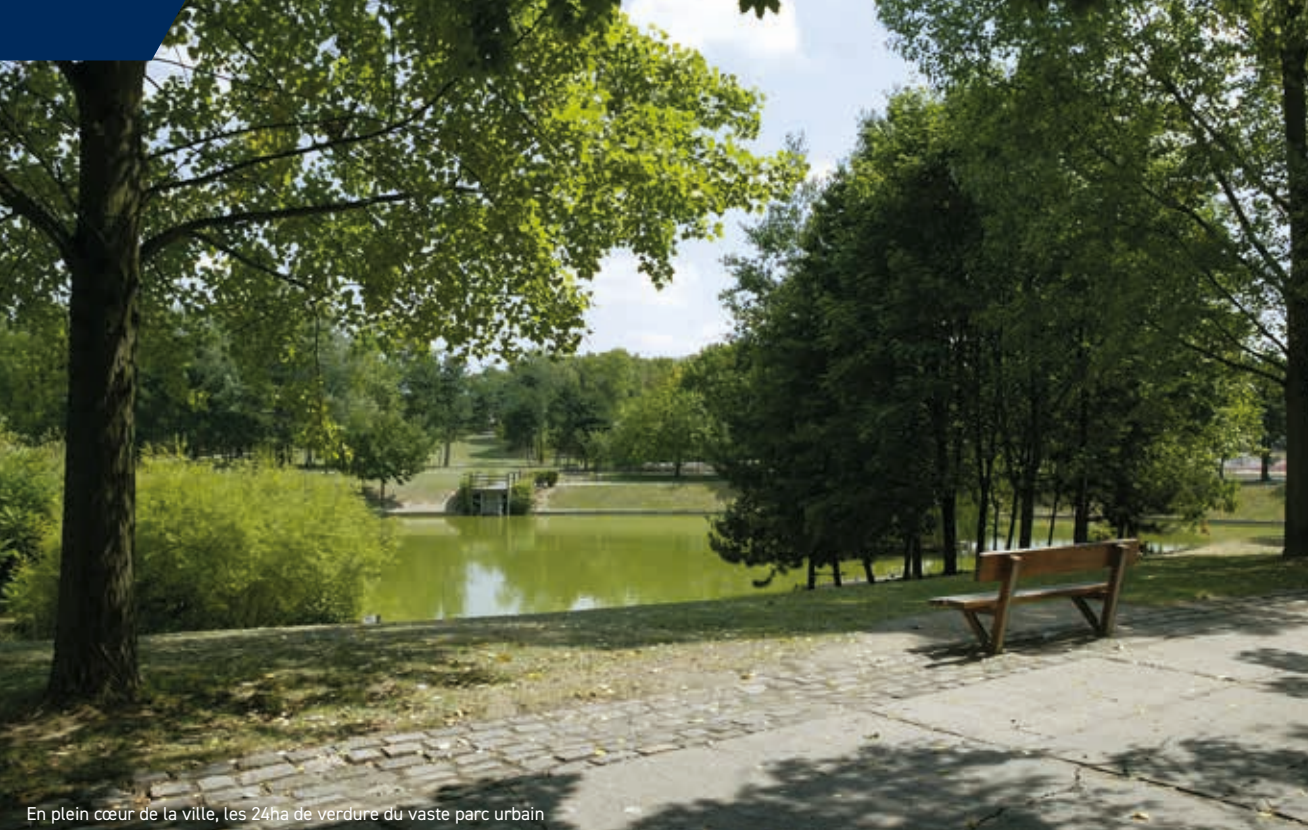
En plein cœur de la ville, les 24ha de verdure du vaste parc urbain