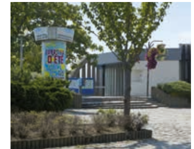
Le parvis de la gare RER B agréablement paysager. Le RER B relie Paris en 16 min seulement.

Des transports qui desservent Paris et les pôles économiques majeurs