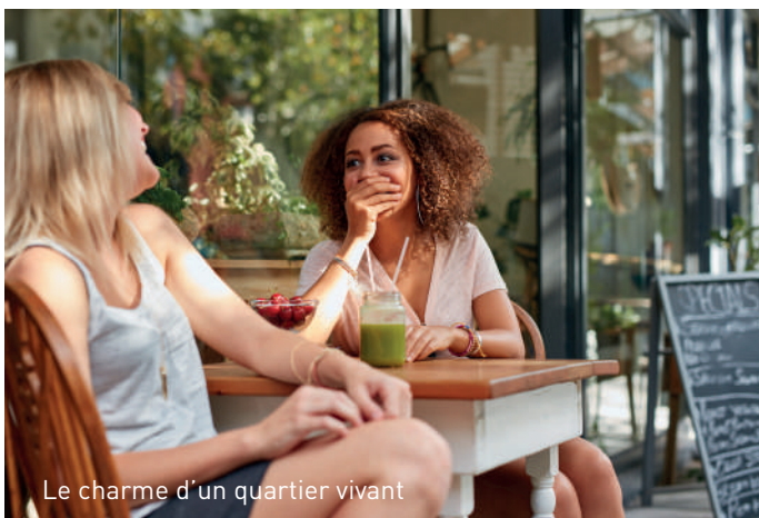
Le charme d'un quartier vivant

Avec un accès rapide vers la pleine nature, proche de tous les commerces et services, Faites le choix LIBERTY !