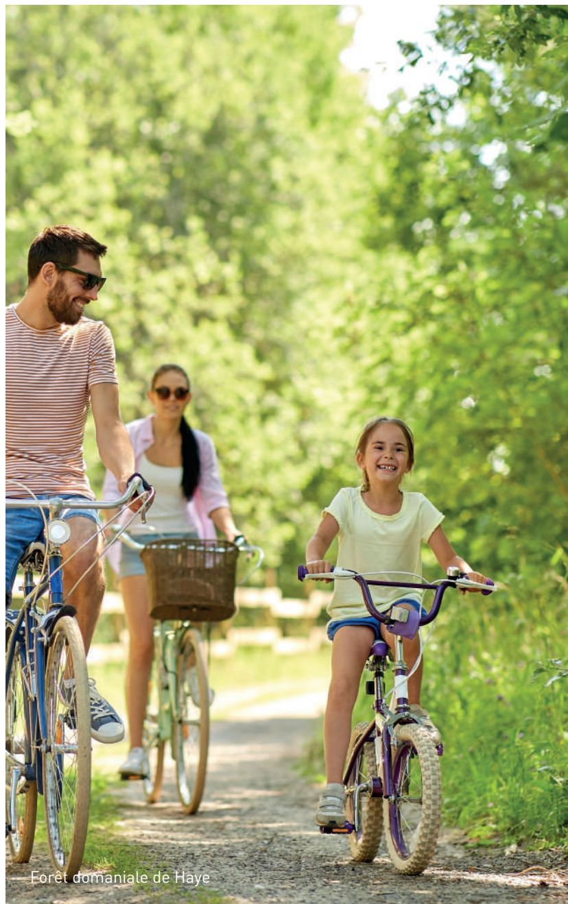
Forêt domaniale de Haye