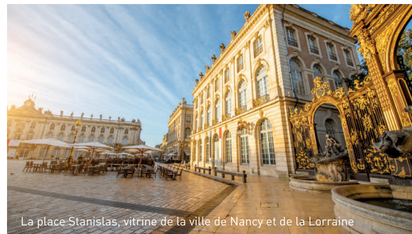
La place Stanislas, vitrine de la ville de Nancy et de la Lorraine