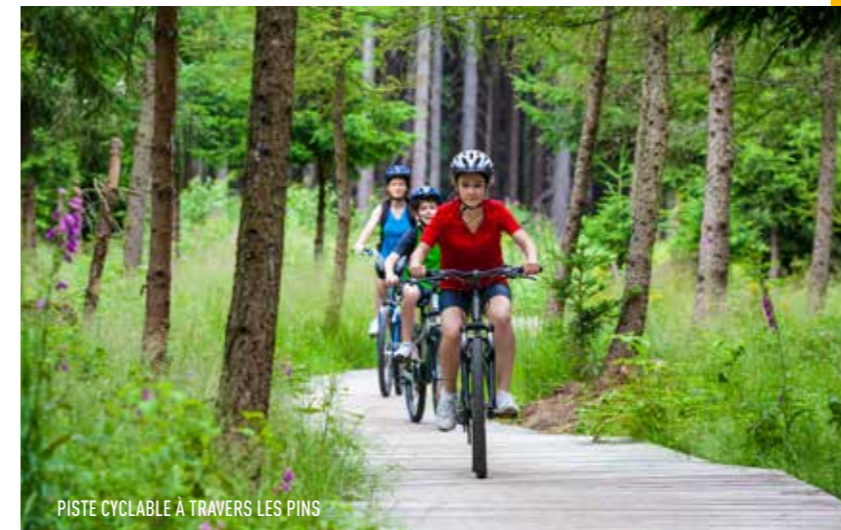
PISTE CYCLABLE À TRAVERS LES PINS