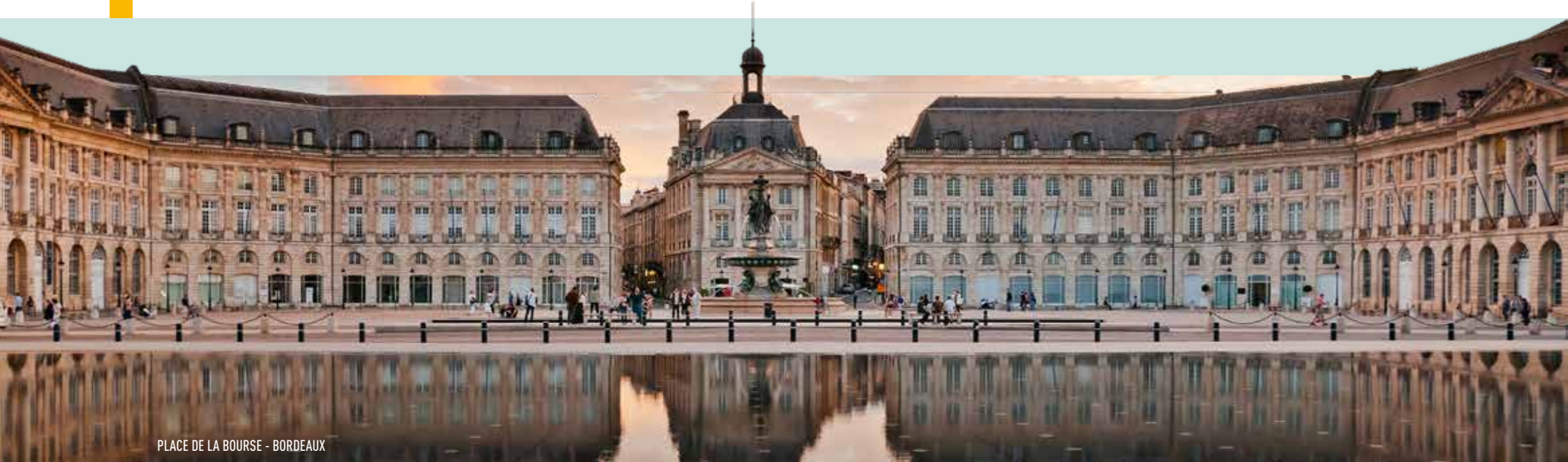
PLACE DE LA BOURSE - BORDEAUX