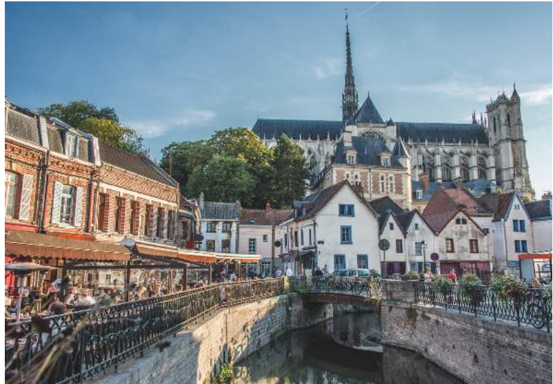
Le quartier Sain-Leu, lieu de l'animation authentique amiénoise

Amiens Métropole, située à une heure de la mer et bientôt reliée, par la gare TGV, à l'aéroport international Roissy Charles-de-Gaulle offre un équilibre parfait entre qualité de vie et opportunités économiques.