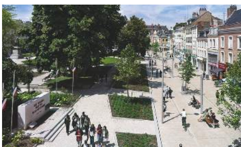
Un centre-ville amiénois piéton aux nombreux services