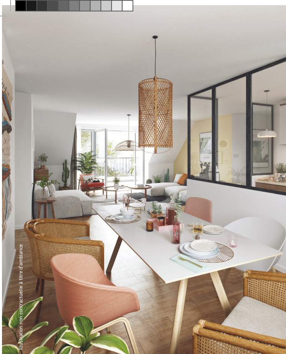
Illustration non contractuelle à titre d'ambiance

“ Nous sommes particulièrement vigilants sur le choix des matériaux et des équipements pour offrir, chaque fois, des finitions soignées et une qualité irréprochable.