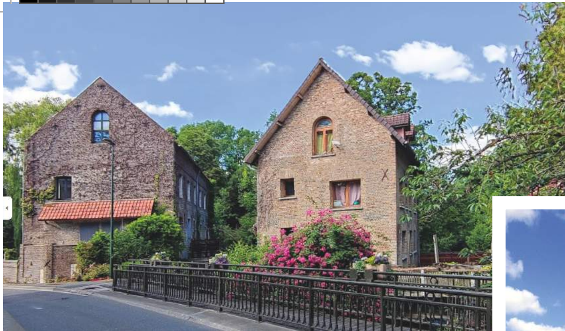
Le Parc du Pré du Moulin de Pont-de-Metz

A 4 km de l'hyper-centre d'Amiens, Pont-de-Metz doit son nom à un pont enjambant la rivière La Selle, existant tout près d'un mes. Bénéficiant de son appartenance à Amiens Métropole, la commune a su garder son caractère bucolique tout en offrant des services de proximité (crèches, écoles) ainsi que des infrastructures culturelles et sportives.