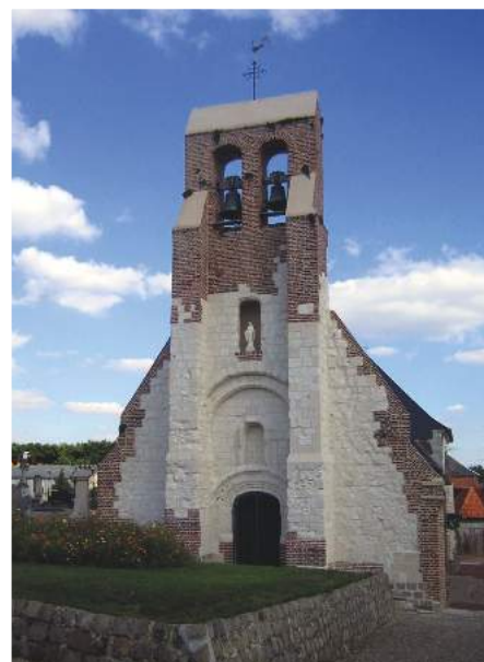
L'Église Saint-Cyr-et-Sainte-Julitte de Pont-de-Metz

A 4 km de l'hyper-centre d'Amiens, Pont-de-Metz doit son nom à un pont enjambant la rivière La Selle, existant tout près d'un mes. Bénéficiant de son appartenance à Amiens Métropole, la commune a su garder son caractère bucolique tout en offrant des services de proximité (crèches, écoles) ainsi que des infrastructures culturelles et sportives.