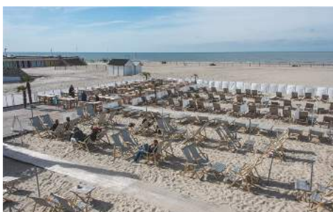
Des villes balnéaires à 1 h de route

Pont-de-Metz, joyau niché au cœur d'Amiens Métropole, offre bien plus qu'une simple adresse : c'est un art de vivre. Imaginez-vous dans un cadre bucolique, baigné par les méandres apaisants de la Selle. Parc du Pré du Moulin, parc et étang de la Ballastière, ici, la nature se mêle à l'urbanisme pour créer une atmosphère unique, où le calme règne en maître.