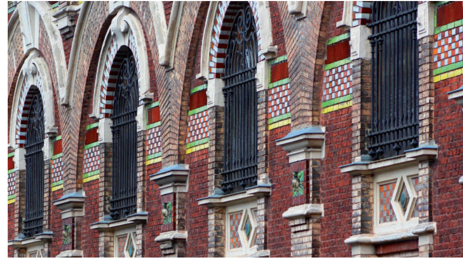
L'architecture colorée du Nord dans les ruelles de Béthune