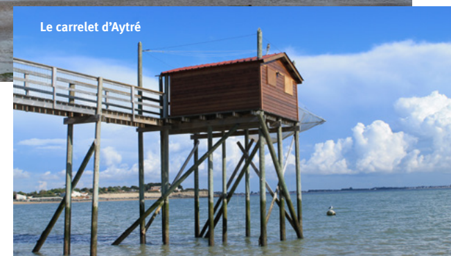
Le carrelet d'Aytré