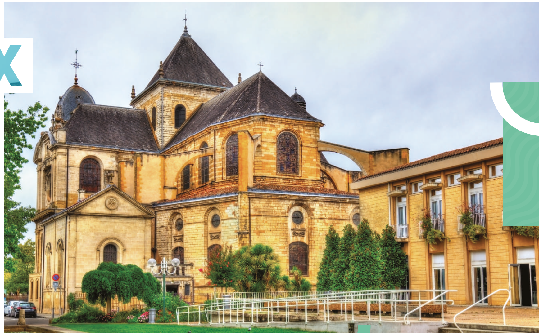
CATHÉDRALE NOTRE DAME, DAX