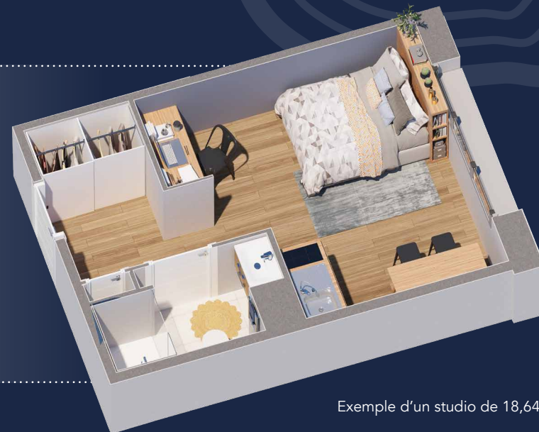
Exemple d'un studio de 18,64 m 2