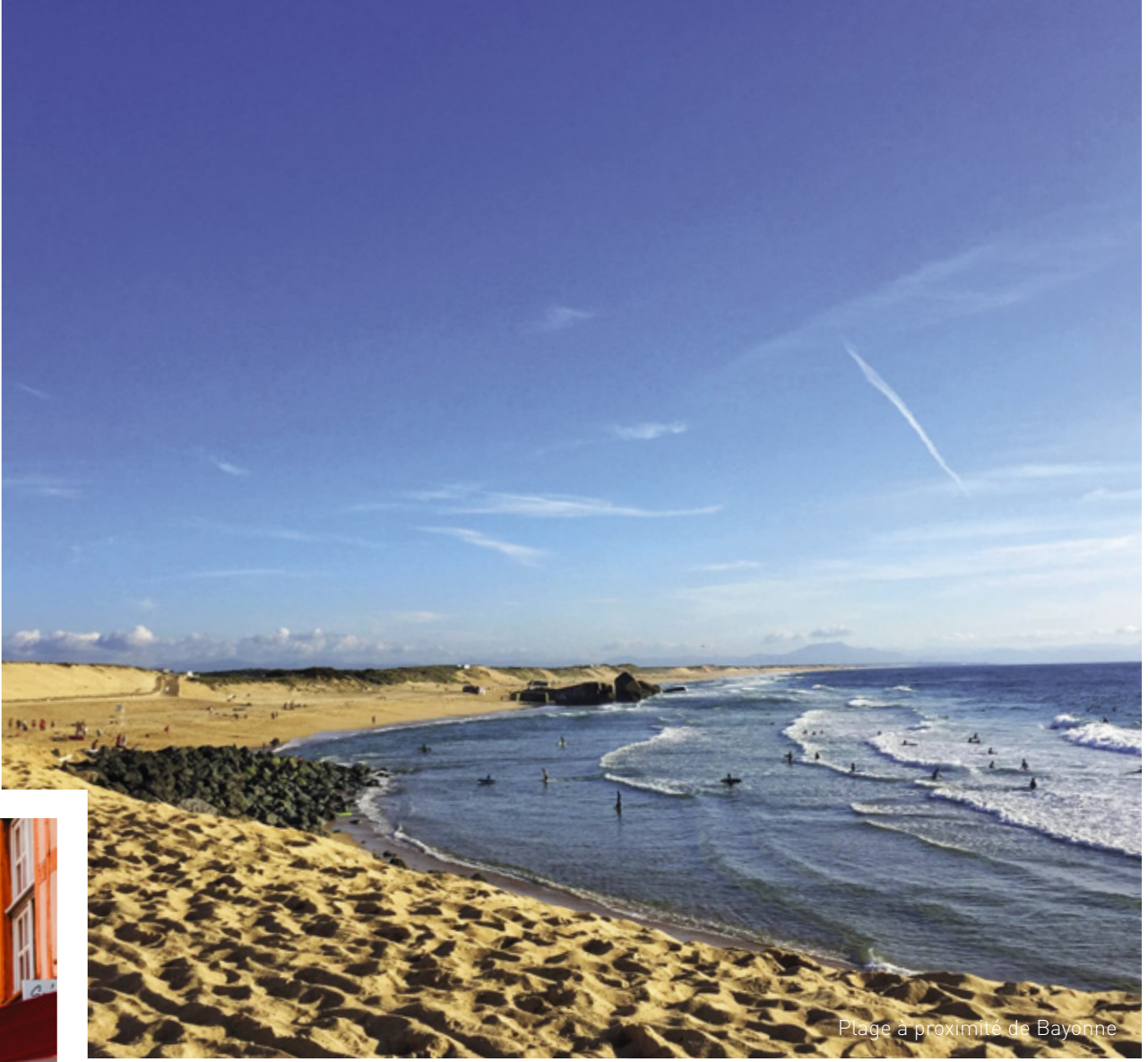
Plage à proximité de Bayonne

Bayonne, commune du Sud-Ouest de la France aux 51 411 habitants, cultive une identité basque riche dans sa diversité : architecture colorée, idiome local et gastronomie rendant hommage à la terre comme à l'océan. Traversée par l'Adour et La Nive, la ville dispose d'une situation formidable à proximité des stations balnéaires célèbres de Biarritz, Anglet, Saint-Jean-de-Luz et Hendaye. Première ville de la communauté d'Agglomération Pays-Basque, elle dispose également d'un tissu économique dynamique et d'une croissance démographique constante depuis plusieurs années.