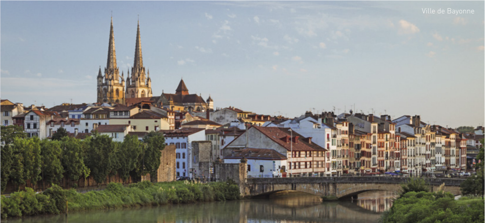
Ville de Bayonne