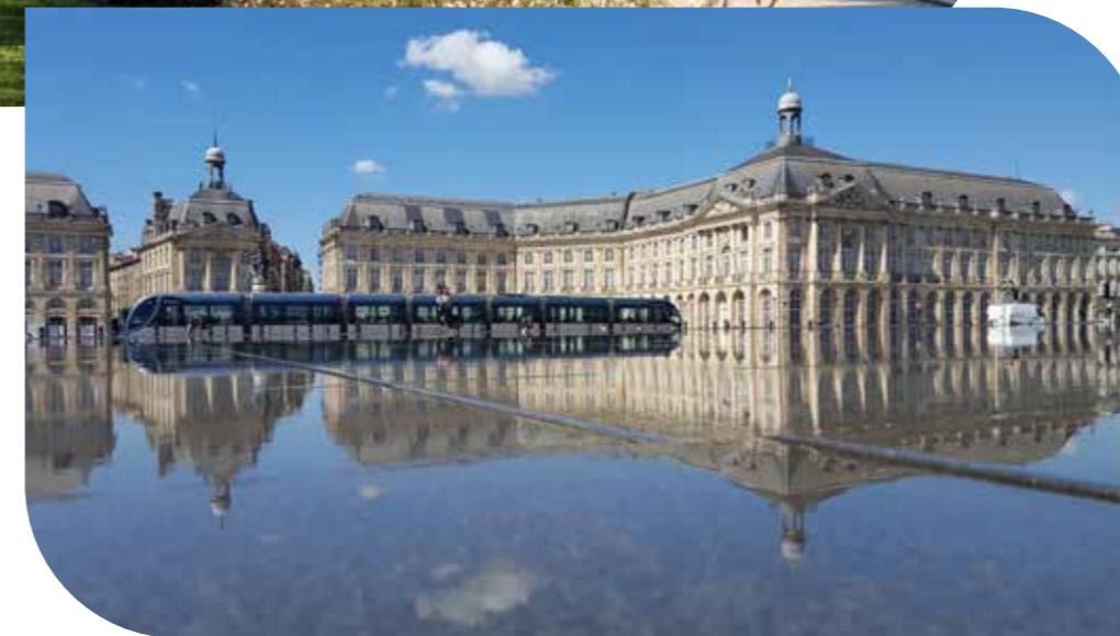
Tramway Place de la Bourse Bordeaux

À 20 minutes du centre-ville de Bordeaux , les Haillanais profitent du dynamisme de la capitale Aquitaine dans un cadre bucolique. À proximité des principales voies de communication (bus, tramway, aéroport), la mobilité y est facilitée pour tous les trajets.