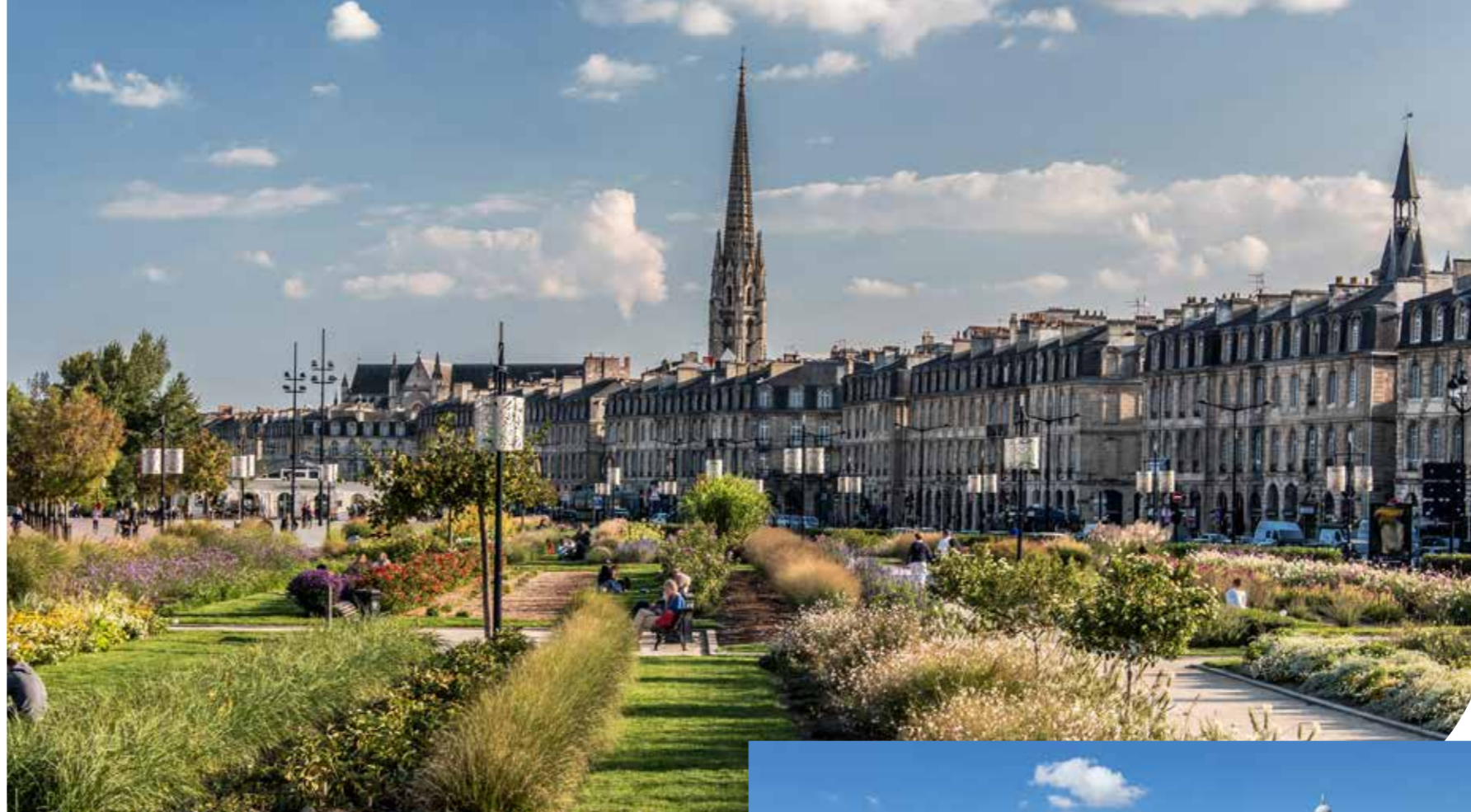
Les quais de Bordeaux